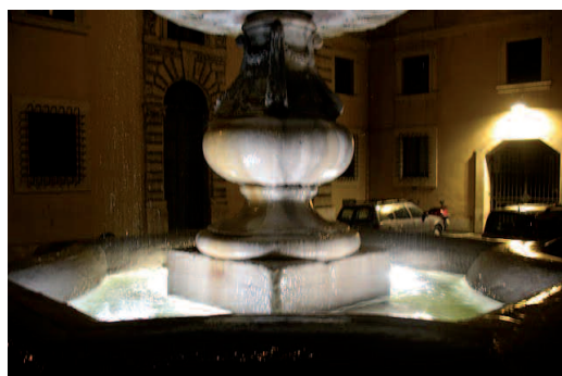
Roma. Piazza Campitelli